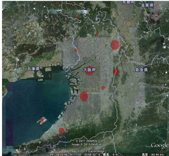
大阪の蒸発散の変動 (イメージ)