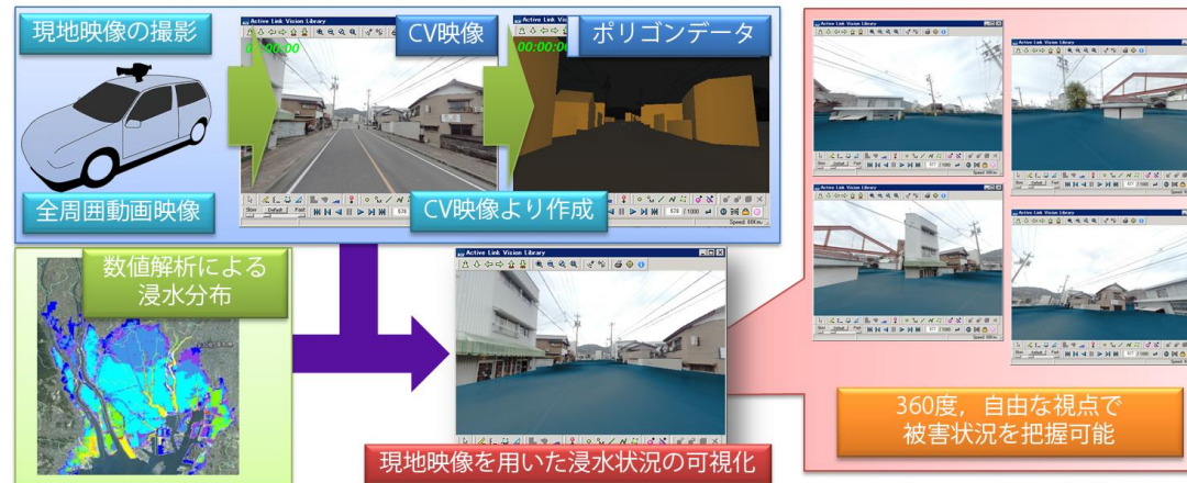
現地映像を用いた3次元災害リスク可視化技術手法の概要