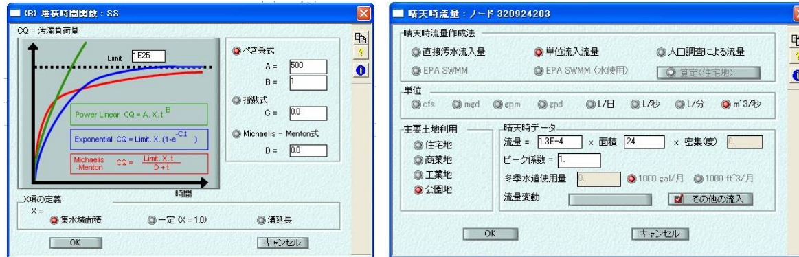
流入汚濁負荷量の設定例