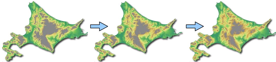
積雪深分布の経年変化の推定